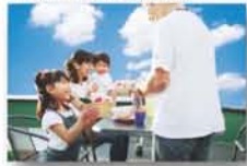
■自分だけのガーデンライフ